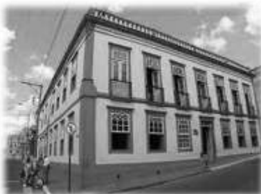
Museu Sacro N. Senhora do Rosário (e) e Casa da Cultura (d)

Além das opções culturais oferecidas pelos museus, teatros e campi das universidades locais, a cidade conta com diversas atrações culturais, tais como: