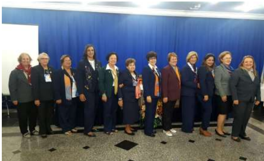
Coordenadoras da ASR do Distrito 4560 presentes na Conferência da Inspiração – São Lourenço/MG