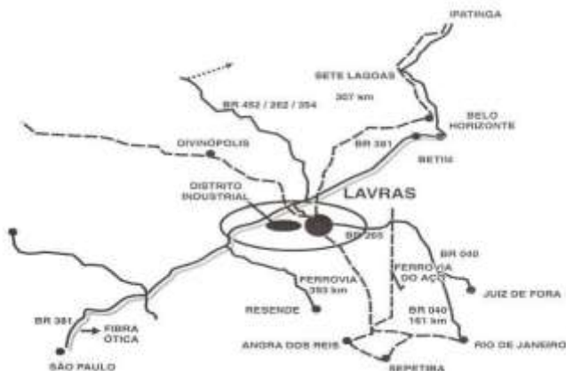
Localização e principais vias de acesso a Lavras, MG.