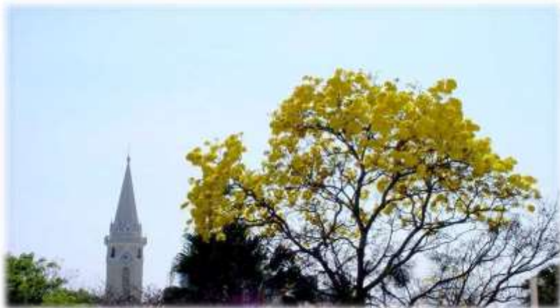
Igreja da Matriz e Ipê Amarelo – Lavras/MG

O município de Lavras, MG, situado no Sul de Minas Gerais, foi fundado em 1729 (data presumível), transformado em município em 13 de outubro de 1831, desenvolvendo-se em torno da capela de Santana, hoje igreja do Rosário. Em 20 de julho de 1868, obteve a emancipação política e administrativa e em 8 de outubro do mesmo ano foi transformada em comarca.