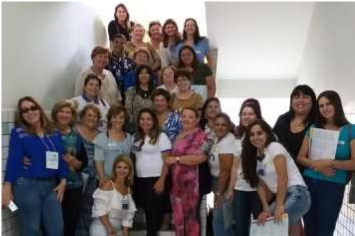
Companheiras que participaram da Assembleia em Abril 2019- Lavras

Homenageio aqui, de coração e com orgulho, todas as mulheres. Mulheres guerreiras, lutadoras, que ao longo da história da humanidade conquistaram seu espaço na sociedade de forma marcante. Passaram de pessoas submissas, com olhar para baixo, a pessoas atuantes que fazem a diferença por onde passam. Conquistaram o direito ao voto, se fizeram respeitar nas universidades no trabalho fora de casa e dentro de casa também. Ganhos que ficaram para sempre. Com isso, mulheres, nos tornamos fortes e donas das nossas vidas. São essas mulheres, guerreiras, que fazem parte das ASR's, fazem a diferença na vida da sua comunidade. Colaboram em muito com o Rotary Club de sua cidade mantendo essa parceria de muitos anos. Lutam por melhorias na vida dos que precisam de ajuda. Fazem campanhas, rifas, jantares... Tudo que for preciso para arrecadar ajuda e beneficiar ao próximo. Amigas da Casa da Amizade sintam-se abraçadas. Parabéns pelo seu trabalho!