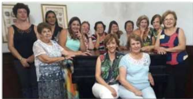
Reunião do Colégio de Coordenadoras realizado em Lavras.

OBSERVAÇÃO: Algumas de nossas Coordenadoras já nos deixaram e foram morar no plano superior. Elas nos deixaram seu exemplo, seu legado, seu trabalho e, agora, saudades.