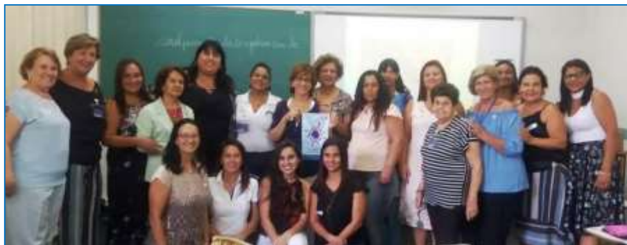
Companheiras que participaram do PETS em Março de 2019 – Lavras/MG